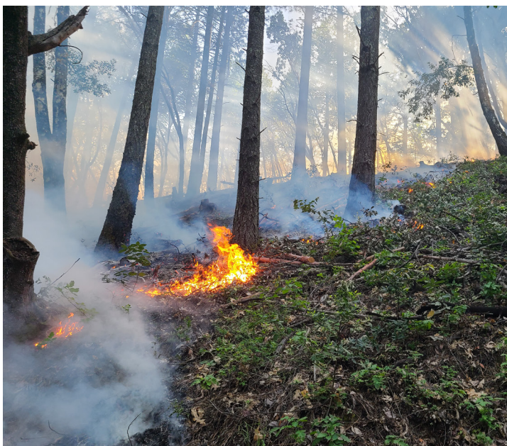
Quema prescrita en Pacific Union College, del condado de Napa, con el apoyo de las asociaciones de quema prescrita de Napa, Solano y Yolo.